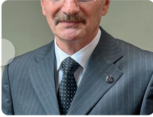
Mesterséges intelligencia, dró...

from 'Pesti Ügyvéd / 2023. június – július'