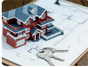
Polgári perben szerezte vissza...

from 'Pesti Ügyvéd / 2023. június – július'